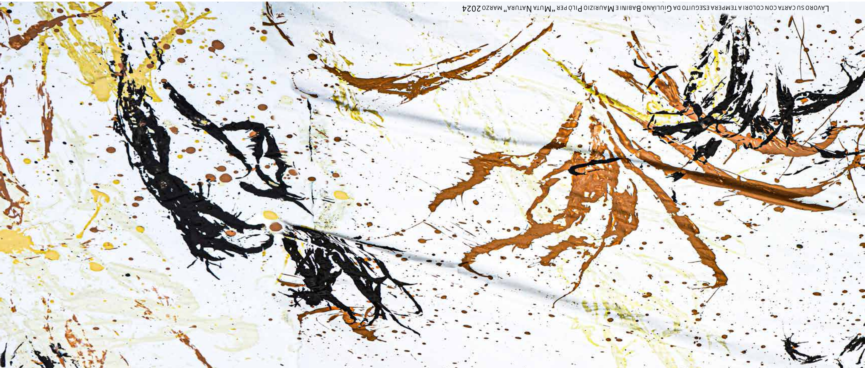
LAVORO SU CARTA CON COLORI A TEMPERA ESEGUITO DA GIULIANO BABINIE MAURIZIO PILO PER "MUTA NATURA" MARZO 2024