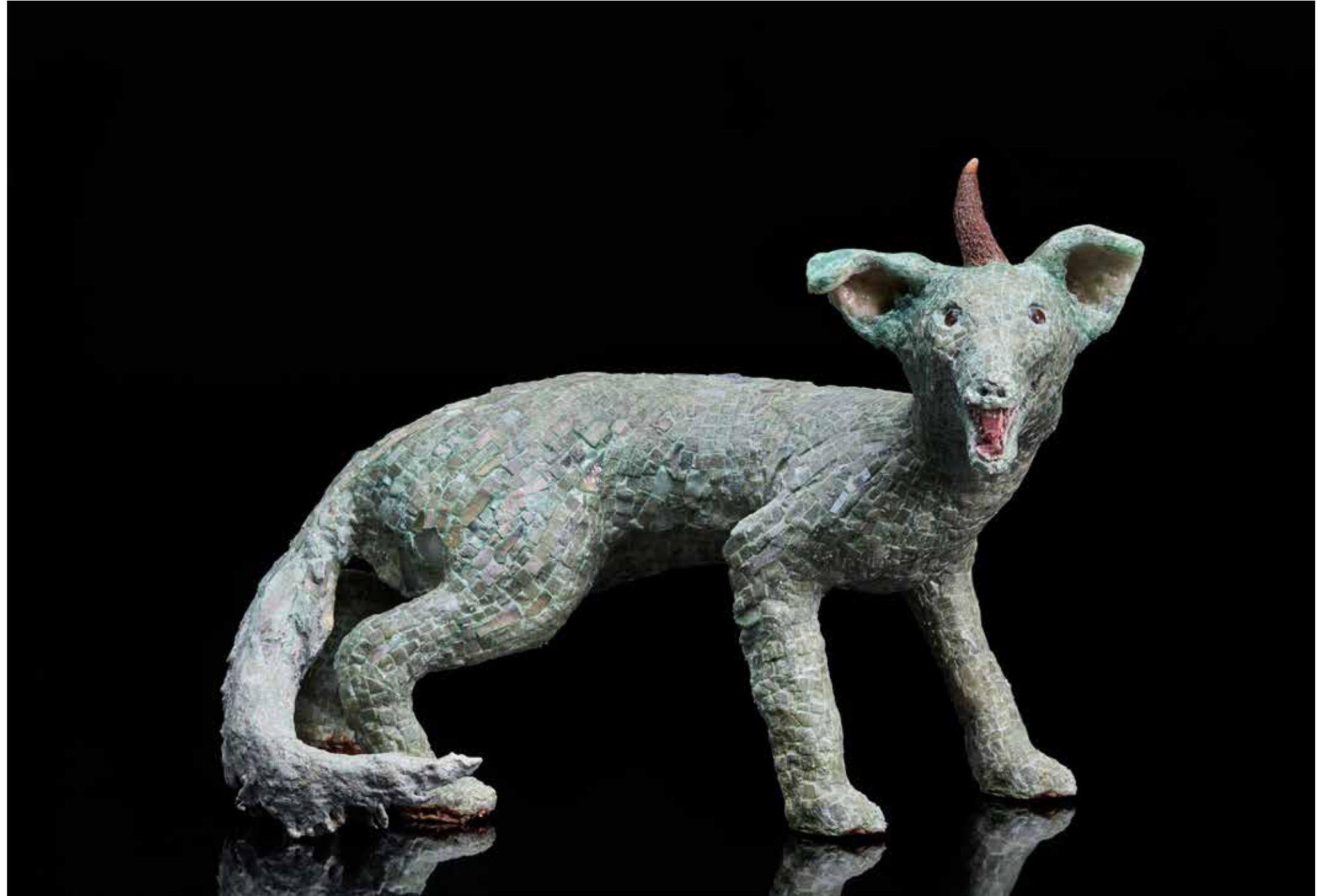
Omicis Fennec, 2019