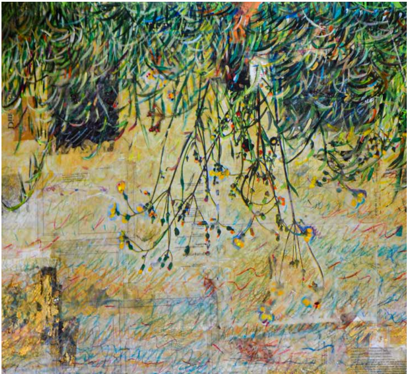
Fiume d'oro. 100x150 cm (part). 2024. Stampa fotografica incollata su tela, acrilico e pastelli a olio su pellicola.