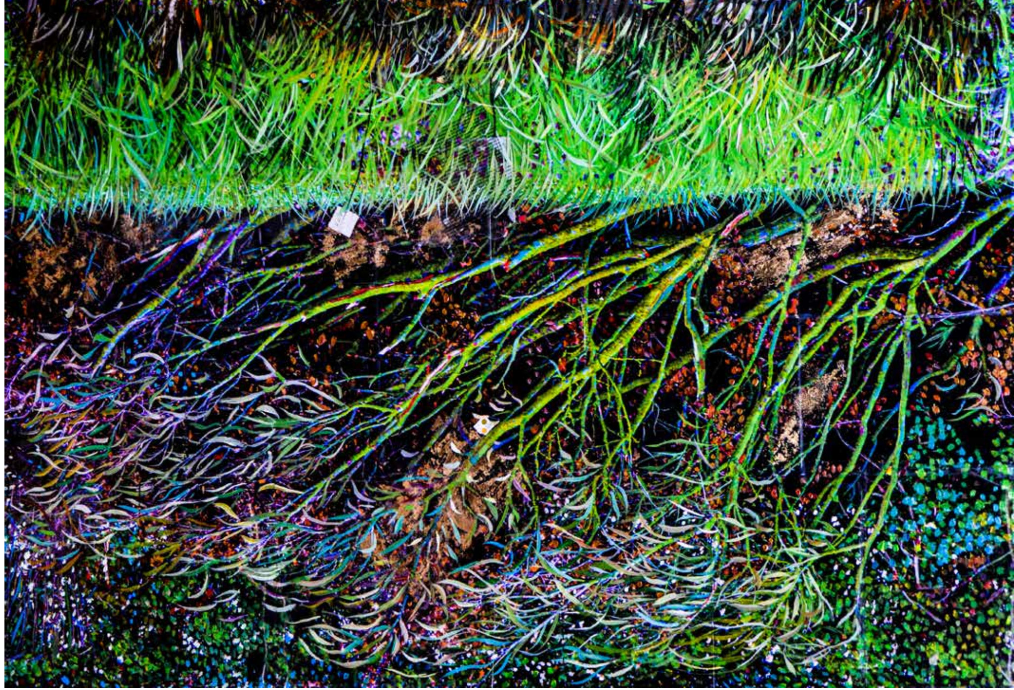
Mappa di un paesaggio tra gli alberi caduti che rinascono. 100x150 cm (part), 2024. Stampa fotografica incollata su tela, acrilico e pastelli a olio su pelliola.