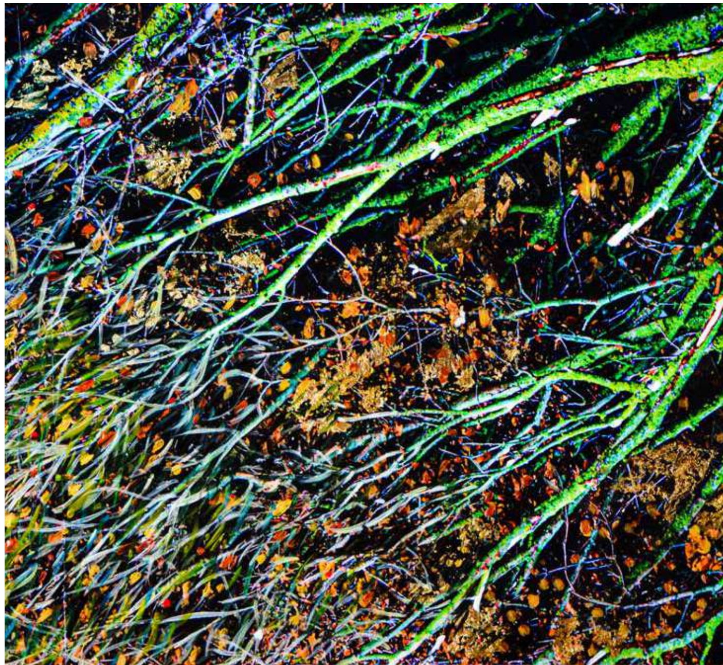
Mappa di un paesaggio tra alberi che rinascono. 70x100 cm (part). 2023. Stampa fotografica, acrilico, pastelli a olio e oro su pellicola.