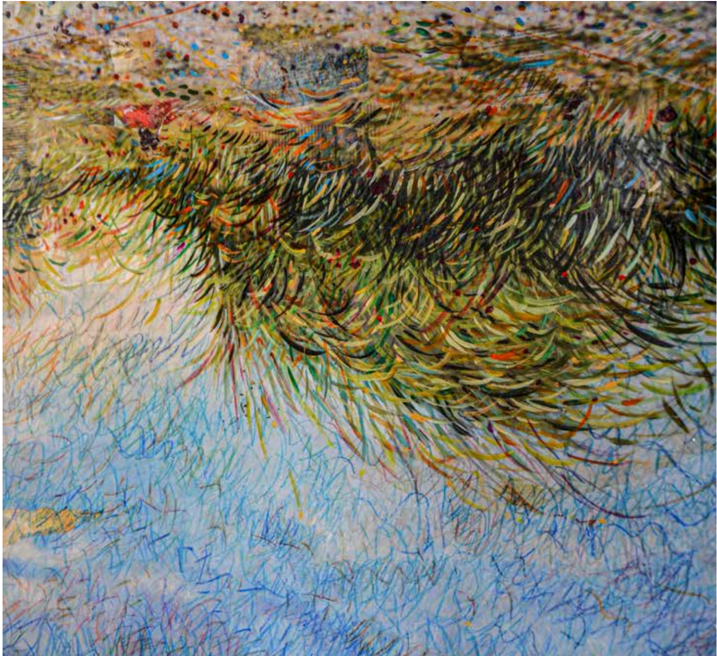
Salendo sulla duna. 100x150 cm (part) 2024. Stampa fotografica incollata su tela, acrilico e pastelli a olio su pellicola.