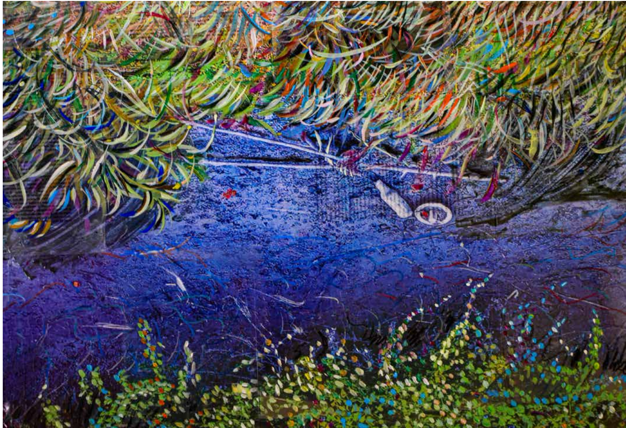
Fume blu. 100x150 cm (part), 2024 stampa fotografica incollata su tela, acrilico e pastelli a olio su pellaola.