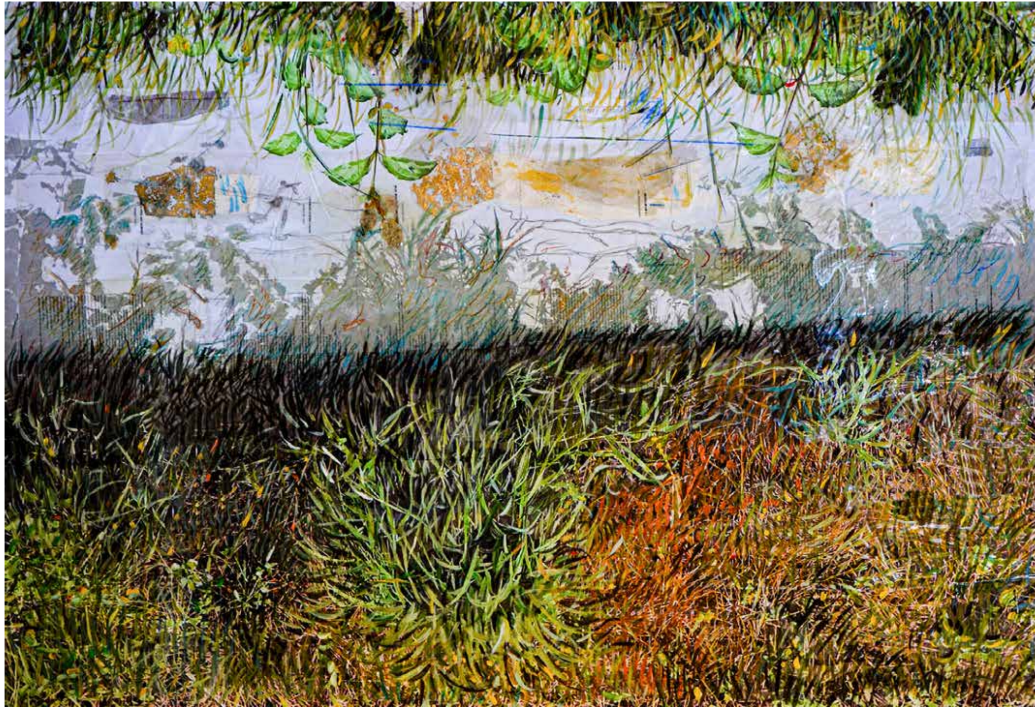
Mappa tra le sponde. 100x150 cm (part), 2023

stampa fotografica incollata su tela, acrilico, pastelli a olio su pellicola e foglia oro.