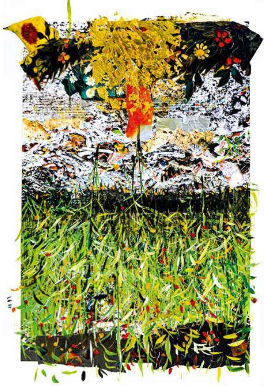
Penso ai fiori d'oro. 50x70 cm 2023. Stampa fotografica incollata su cartone, acrilico, pastelli a olio su pellicola e foglia oro.