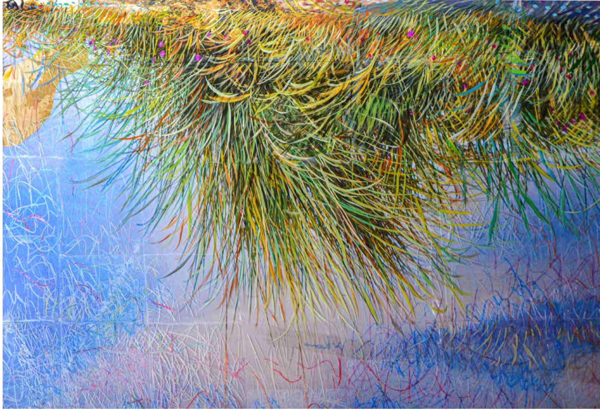
Davanti alla duna. 100x150 cm (part.) 2024 stampa fotografica incollata su tela, acrilico e pastelli a olio su pelticola.