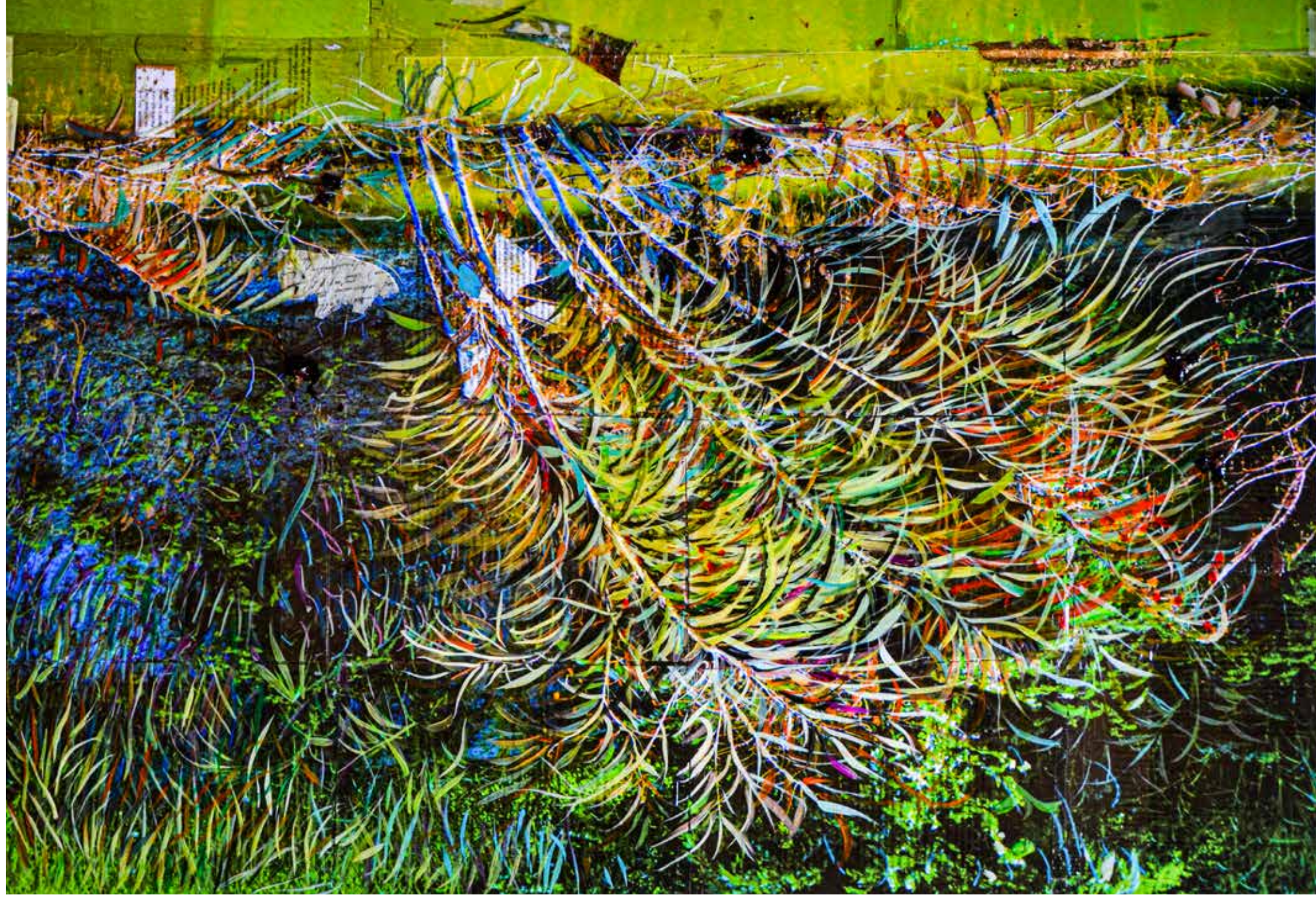
Fiume verde. 70x100 cm (part.) 2023. Stampa fotografica incollata su tela, acrilico, pastelli a olio su pellicola e foglia oro.