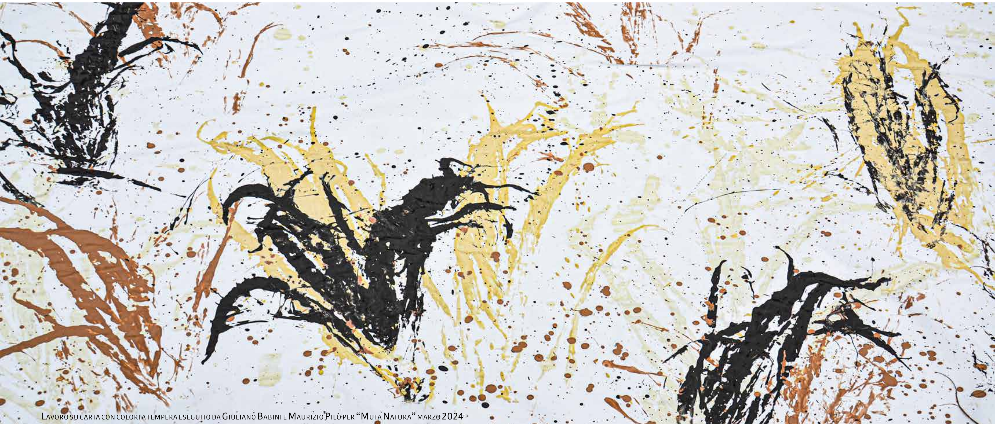
LAVORO SU CARTA CON COLORI A TEMPERA ESEGUITO DA GIULIANO BABINI E MAURIZIO PILO PER "MUTA NATURA" MARZO 2024